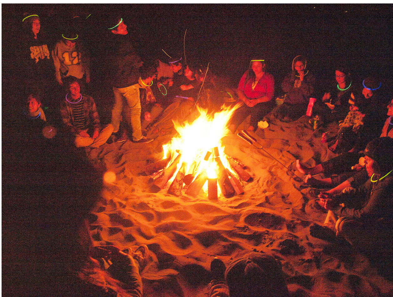
Latin@ Peer Mentoring bonfire fall 2012, students gather around at Clam beach to tell scary stories, make hot dogs and eat s'mores.